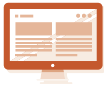
インターネットに 接続されているデバイス