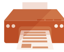
A4サイズが 印刷できるプリンタ

「調査書」「受験票」「入学志願票」「宛名ラベル」を印刷します。プリンタをお持ちでない場合は、USBメモリーにファイルを保存して、コンビニエンスストアなどで印刷してください。